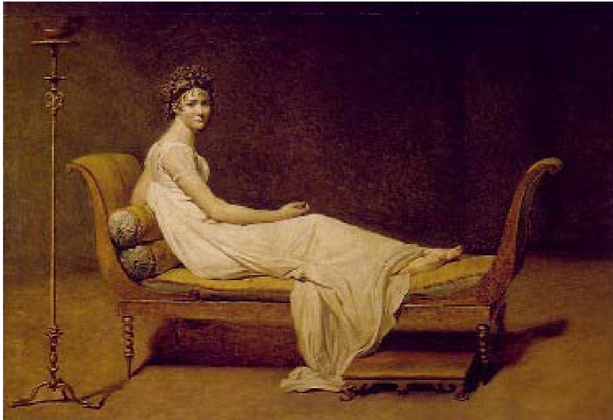
Madame Récamier di DAVID

MADAME Sono neoclassica! Noti la tunica? PRIMO Parla anche questa!!! che mal di testa!! QUARTO Oh parla ancora , sublime immagine! MADAME La veste semplice, di seta morbida Che le mie molli forme seconda E sembra un'onda di spuma candida Da cui emerge la mia beltà. PRIMO Ma come parlano!!! QUARTO Celeste musica... MADAME Ma sullo sfondo il saggio artefice Non volle nulla, nulla dipingere Perché da sola deve risplendere Pura e magnifica la mia beltà. QUARTO L' aurea beltade ond'ebbero Ristoro unico ai mali Le nate a vaneggiar menti mortali MADAME Nudo il mio piede, nude Le braccia di gioielli, Un laccio nero chiude Appena i miei capelli: Non servono gli orpelli Se regna la beltà