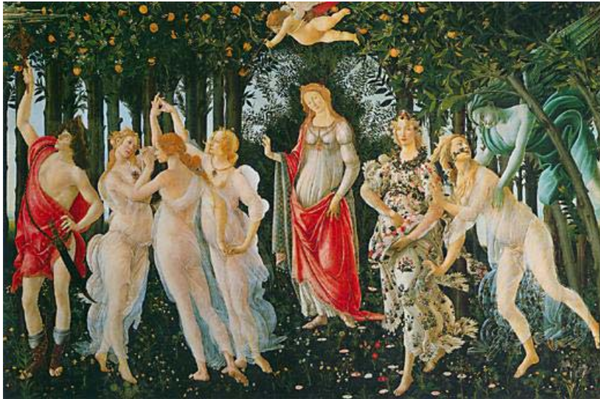
LA PRIMAVERA di BOTTICELLI